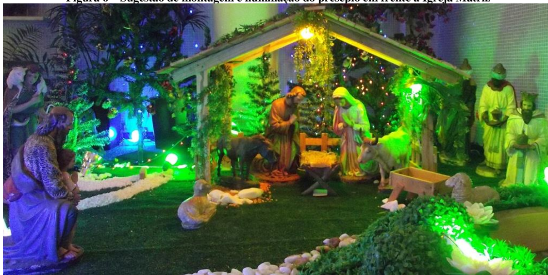
Figura 6 – Sugestão de montagem e iluminação do presépio em frente à Igreja Matriz