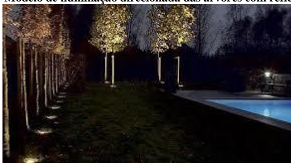
Figura 3 – Modelo de iluminação direcionada das árvores com refletores de led